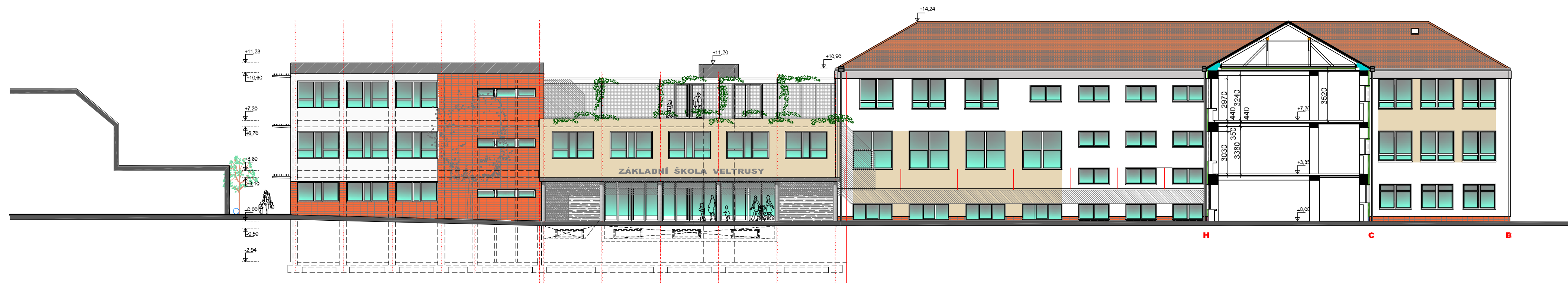
POHLED VÝCHODNÍ M 1 : 200